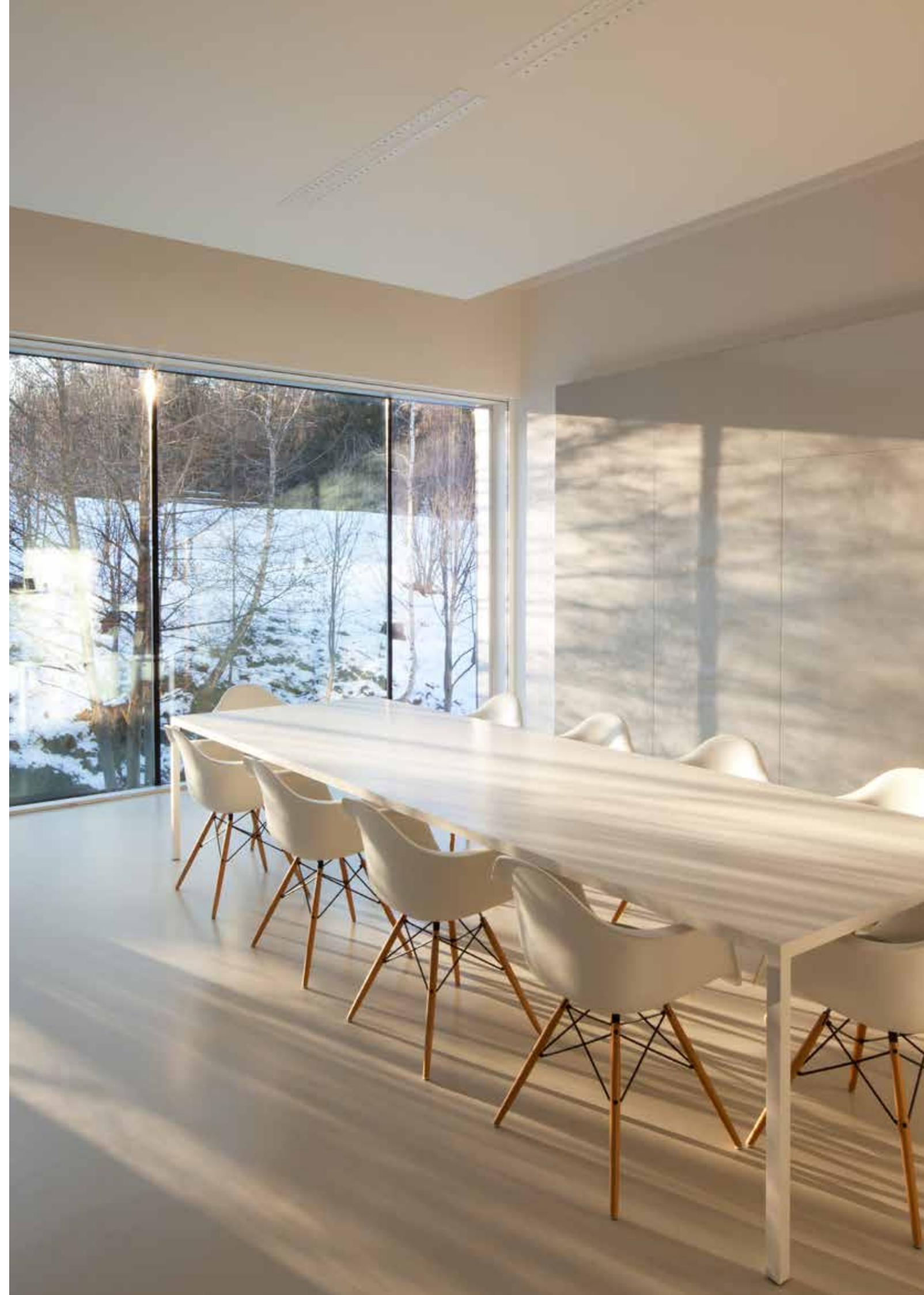
In den Präsentationsräumen können Besucher unterschiedliche Lichtstimmungen erleben. Die Lounge, das Besprechungszimmer und die Aula zeigen auch die Möglichkeiten, Lichtsysteme und neue lichttechnische Materialien zu integrieren. Das Studio ermöglicht Experimente mit unterschiedlichen Leuchten (siehe nächste Doppelseite).